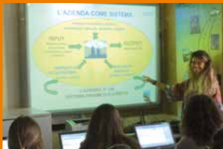
AULA TEMATICA di ECONOMIA AZIENDALE