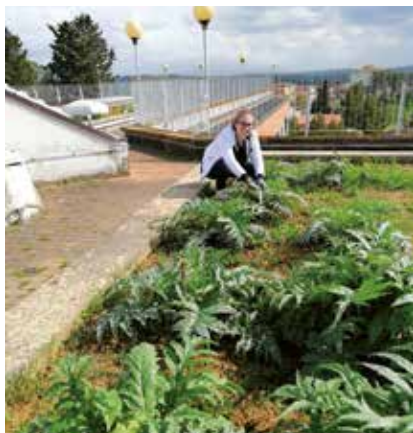
Alunni del biennio lavorano al giardino della Biodiversità sul terrazzo/tetto della scuola: coltivazione dei Carciofi 'grinzosi' di San Miniato