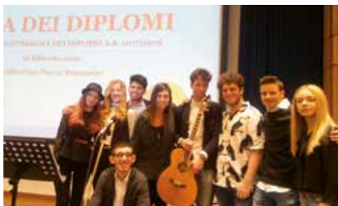
Il CORO del CATTANEO in trasferta