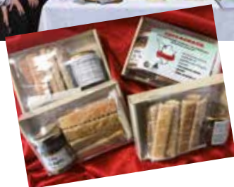
4CA - la mini impresa "Km0 JA" con Tuscasnack, lo 'snack' a Km0