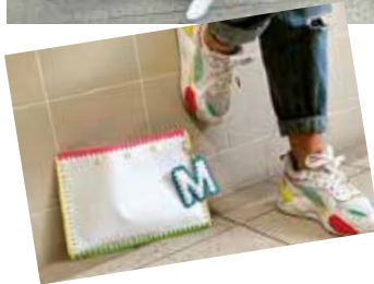
4BA - la mini impresa "Re4banner JA" che ha realizzato la borsa "TECLA"