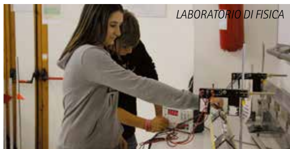
LABORATORIO DI FISICA