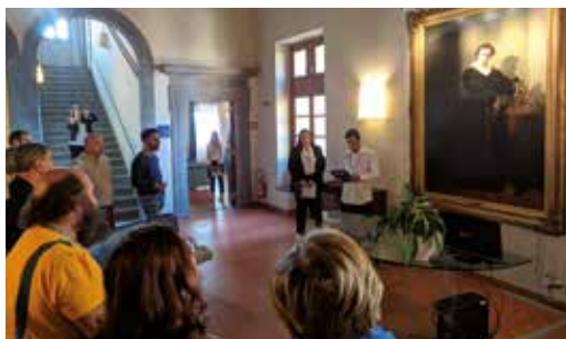
San Miniato: alunni del Corso TURISMO, guide in lingua a Palazzo Grifoni nella manifestazione "Invito a Palazzo".

Spettacolo "I SIPARI DELL'ANIMA": 1° al Teatro della Spirito di San Miniato 2012