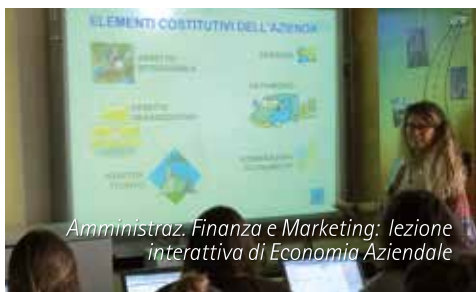
Amministrazione, Finanza e Marketing: lezione interattiva di Economia Aziendale

** Comprensive delle 33 ore annue dell'insegnamento di tutto EDUCAZ. CIVICA.