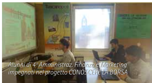
Alunni di 4ª Amministrazione, Finanza e Marketing impegnati nel progetto CONOSCERE LA BORSA