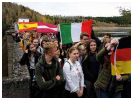
Ottobre 2019 – Alunni del CORSO TURISMO sfilano con i partner europei in GERMANIA

Un nostro progetto Comenius Multilaterale è stato premiato con il LABEL EUROPEO delle LINGUE perché riconosciuto didatticamente innovativo in questo ambito (2013).