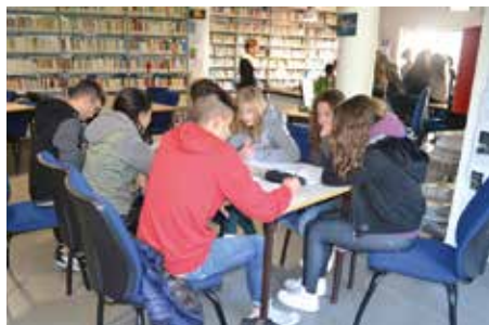
Progetto Metodo di studio