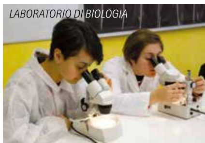
LABORATORIO DI BIOLOGIA