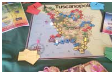
"Tuscanopoly" il gioco con cui la 4B Amm. Fin. e Marketing si è classificata al secondo posto in Italia nel 2010