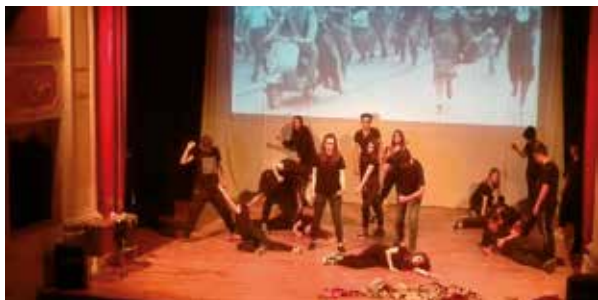
Spettacolo "FANTASIE DANTESCHE" realizzato nell'anfiteatro sul tetto della nostra scuola