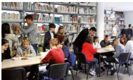
Classe 1CE fa ricerche in biblioteca