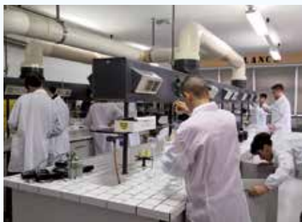
LABORATORIO di CHIMICA del TRIENNIO