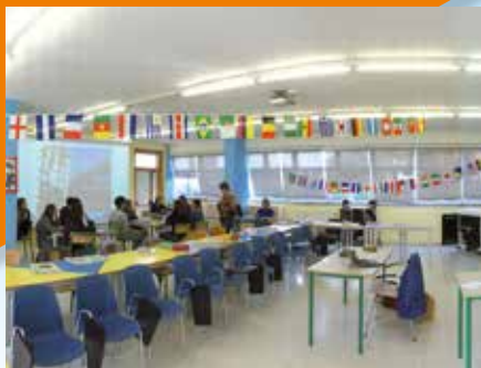
LABORATORIO di LINGUE 1