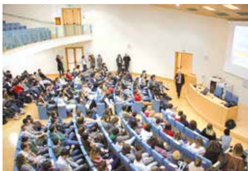
AUDITORIUM: Conferenza dello psicologo